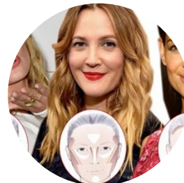
L'arte del contouring