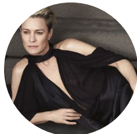
«Ho imparato ad amare»