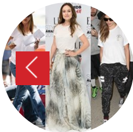
La T-shirt bianca perfetta