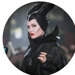
Se non facevamo gli attori?